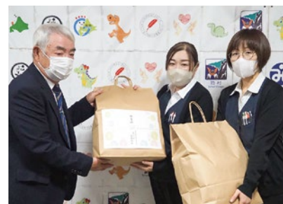
南後志郵便局婦人会よつば会雷電部会 様