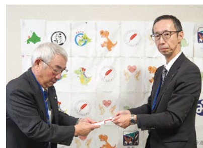
北海道信用金庫ひまわり財団 様

※「寄附金」は、社協の自主財源の要である「社協会費」や「共同募金委員会からの配分金」と並んで重要な収入源となっております。